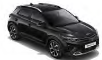
Auroraschwarz Met. (ABP)