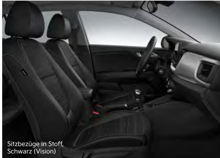
Sitzbezüge in Stoff, Schwarz (Vision)

Hier kannst du dich entspannen: Für den Kia Stonic stehen Sitzbezüge aus Stoff oder Stoff in Kombination mit Ledernachbildung zur Wahl. Die Version Platinum bietet dir Sitze aus hochwertiger Ledernachbildung.