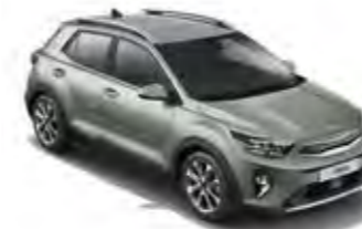
Urbangrün Met. (URG)