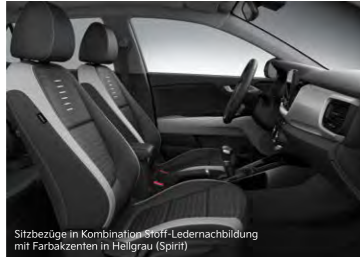
Sitzbezüge in Kombination Stoff-Ledernachbildung mit Farbakzenten in Hellgrau (Spirit)