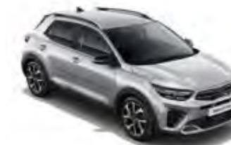
Seidensilber Met. (4SS)