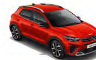
Signalrot Met. (BEG)