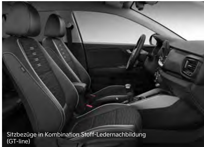
Sitzbezüge in Kombination Stoff-Ledernachbildung (GT-line)