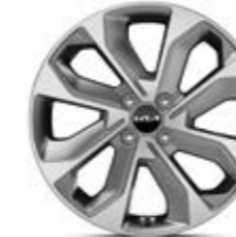
17-Zoll-Leichtmetallfelgen (Spirit und Platinum)