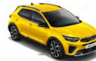
Floridagelb Met. (MYW)