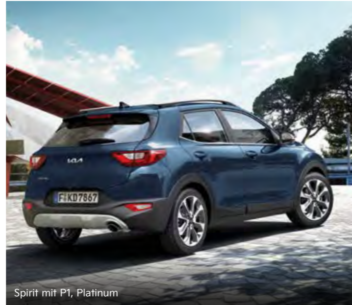
Spirit mit P1, Platinum