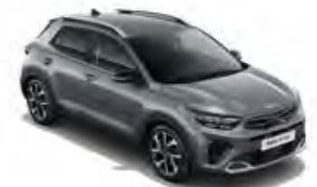
Perennialgrau Met. (PRG)