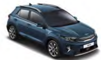
Denimblau Met. (EU3)