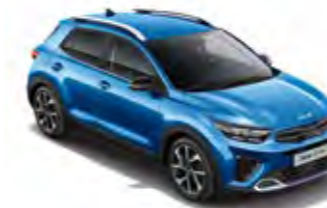
Bathysblau Met. (SPB)